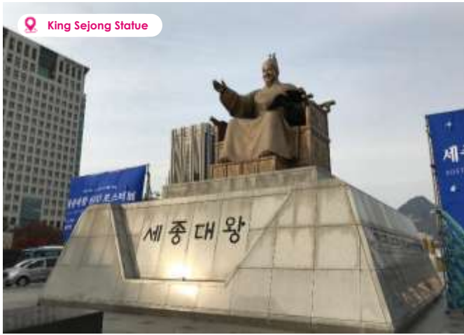
King Sejong Statue