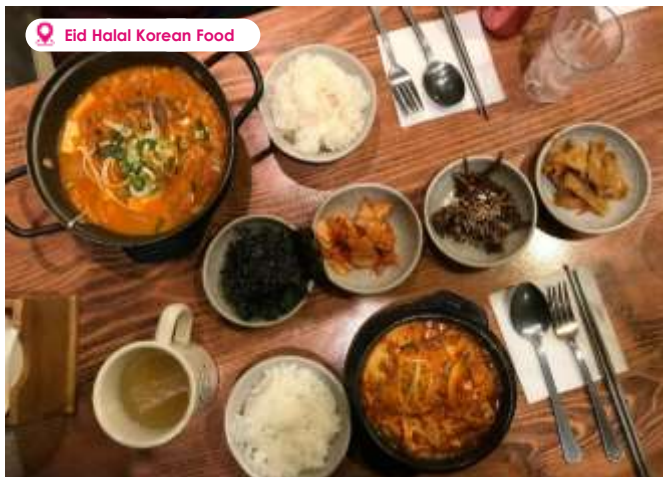
Eid Halal Korean Food